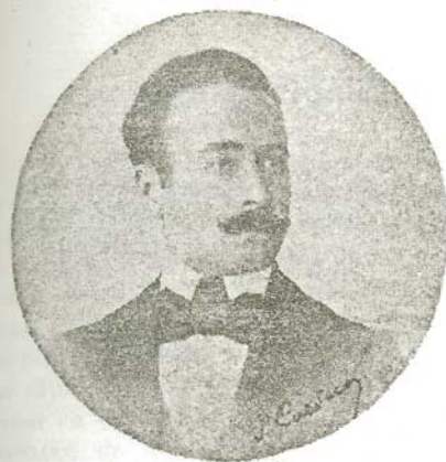
Juan Ramón Molina