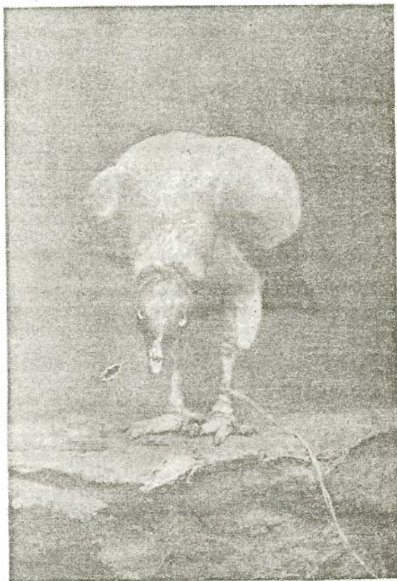
El rey de los zopilotes, tomado del natural vivo

La independencia con que es mirado este pájaro por el zopilote y el zonziche, especialmente cuando está comiendo ha sido dada á conocer por todos los observadores atentos y estudiosos. Como yo he presenciado á menudo estas escenas, dice Schom-